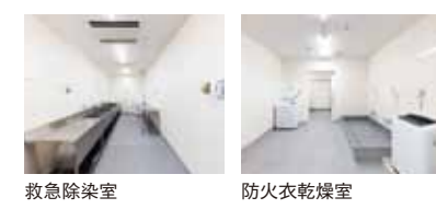
救急除染室 防火衣乾燥室